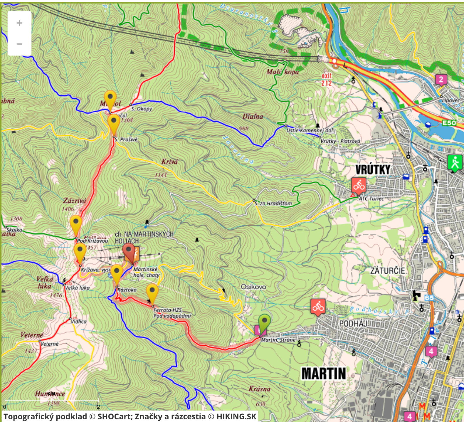
Topografický podklad © SHOCart; Značky a rázcestia © HIKING.SK